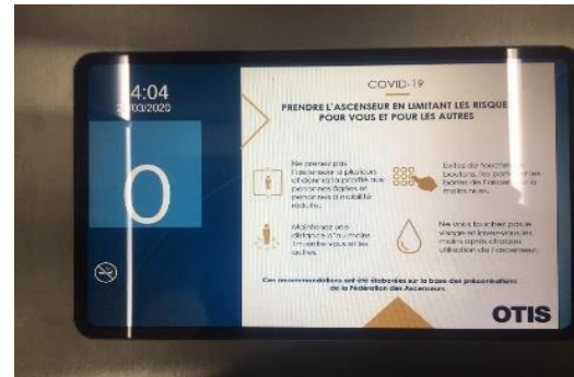
Dans les écrans