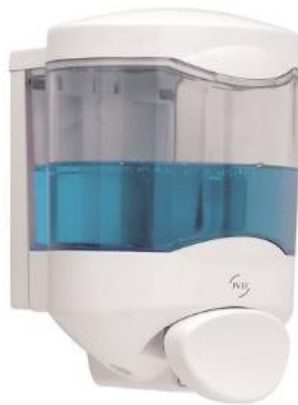
Diffuseur de Gel manuel