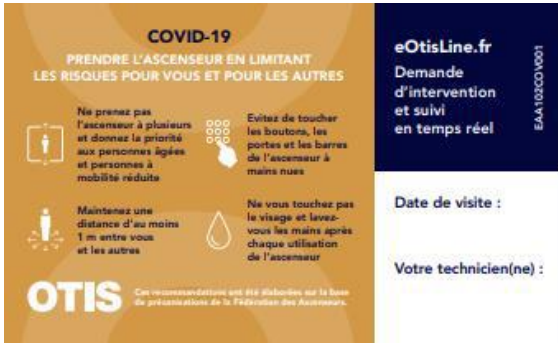
Etiquettes en cabine