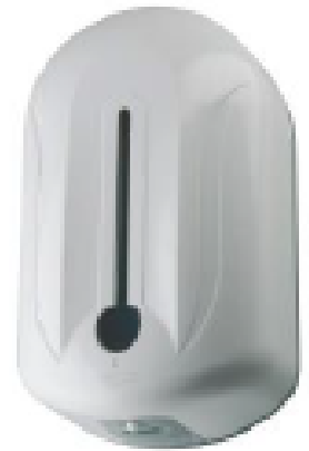
Diffuseur de Gel automatique